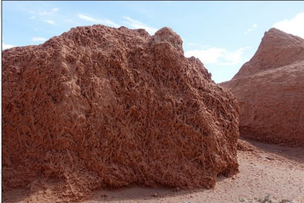
04-02. Красные песчаники, местонахождение палеонтологических остатков – Шабарак-Усу или Баянзаг . Внешний вид склонов - иллюстрация процессов выветривания. Координаты: 44.111850^{\circ} / 103.725800^{\circ} , 1236 м.