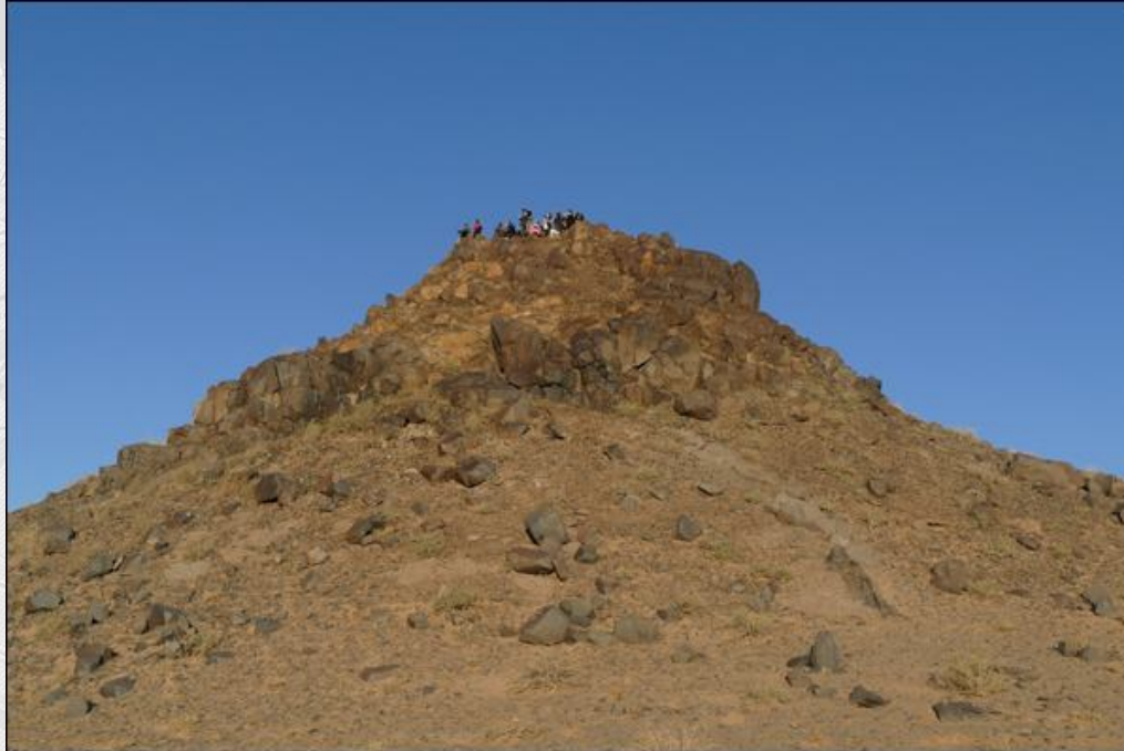
05-02. Группа разрушенных вулканов плейстоценового возраста (Volcano Number – 303807, IAVCEI). Студенты в финале маршрута - на вершине Хоюр-Хайерхан уул . Координаты: 44.242336° / 103.488241°, 1109 м.