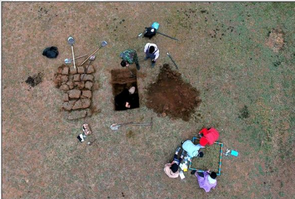
01-03. Древний гранитный массив Бага-Газрын чулуу . Группа студентов Монгольского Национального университета образования выполняющих задания – подготовка почвенного разреза и геоботаническая площадка. Снимок с БПЛА.