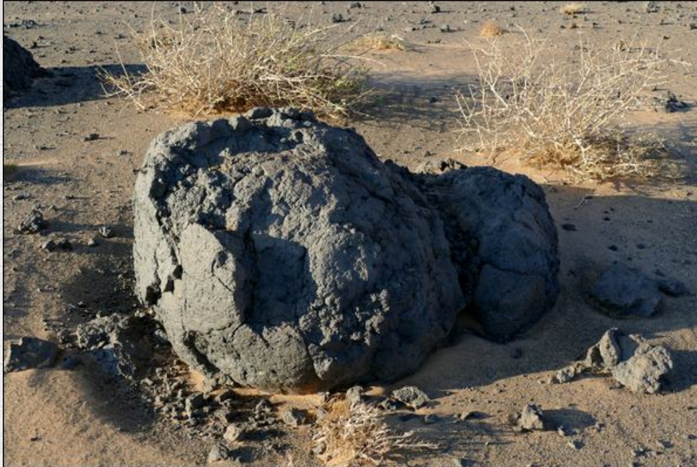
05-01. Группа разрушенных вулканов плейстоценового возраста (Volcano Number – 303807, IAVCEI). Крупная вулканическая бомба вблизи конуса Хоюр-Хайерхан уул . Координаты: 44.242336° / 103.488241°, 1109 м.