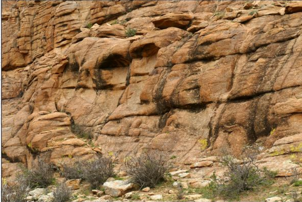
01-01. Древний гранитный массив Бага-Газрын чулуу . Внешний вид и эрозионные формы останцов (ниши выдувания) - иллюстрация процессов физического выветривания. Координаты: 46.220730^{\circ} / 106.057240^{\circ} , высота 1530 м.