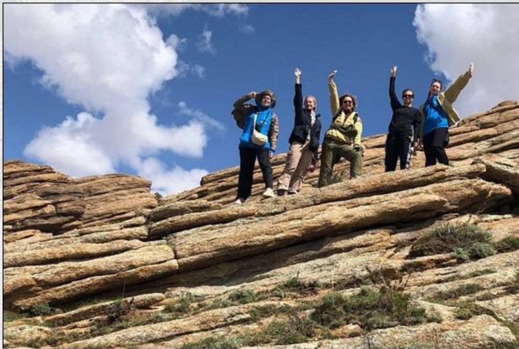
07-01. Гранитный массив Зоргол Хайерхан уул священный массив, отражающим мировоззренческие представления местного населения о родовой горе. Координаты: 46.939770^{\circ} / 105.884780^{\circ}, 1260 м.