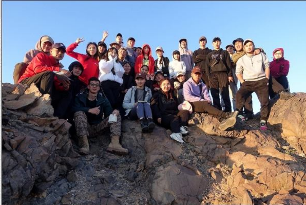
05-03. Группа разрушенных вулканов плейстоценового возраста (Volcano Number – 303807, IAVCEI). Студенты в финале маршрута - на вершине Хоюр-Хайерхан уул . Координаты: 44.22336^{\circ} / 103.488241^{\circ} , 1109 м.