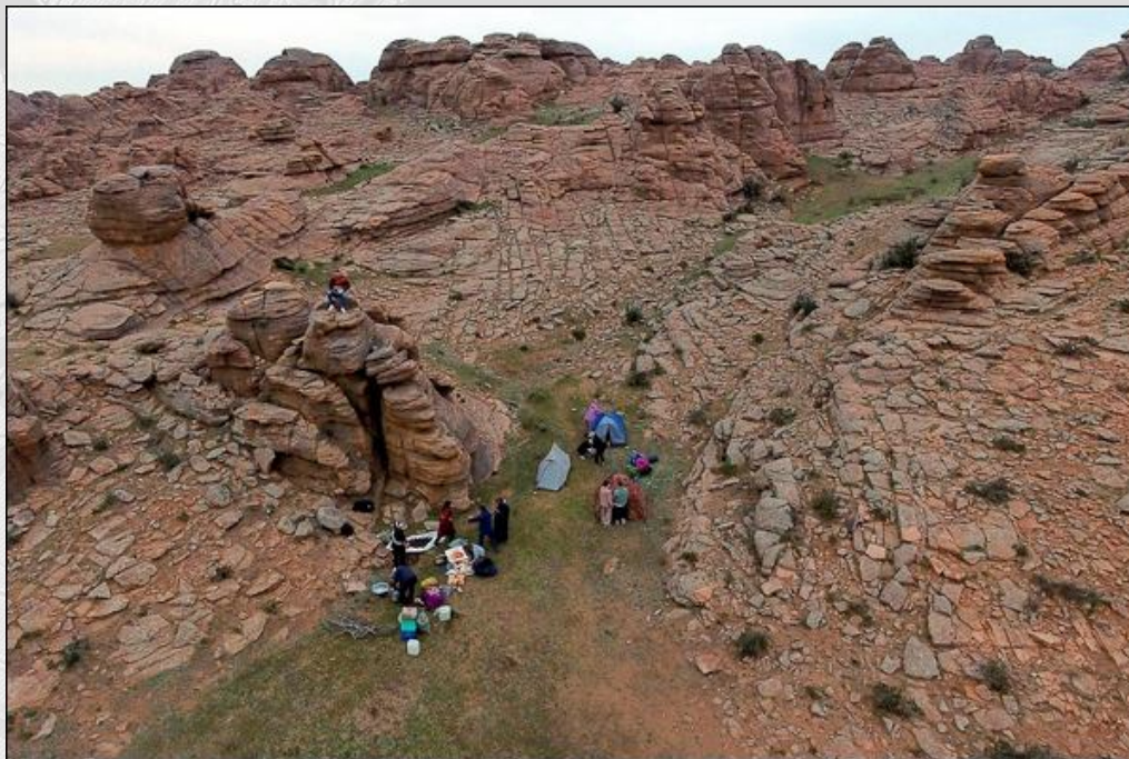
01-02. Древний гранитный массив Бага-Газрын чулуу . Перспективный вид на место первого полевого лагеря. Снимок с БПЛА. Координаты: 46.220730° / 106.057240°, высота 1530 м.