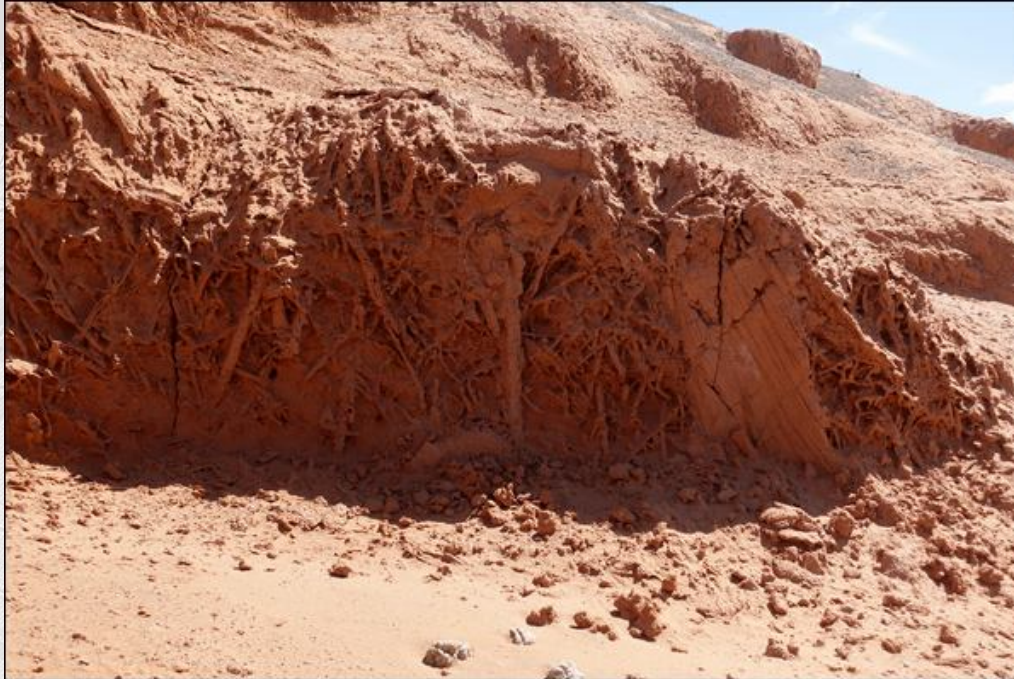
04-01. Красные песчаники, местонахождение палеонтологических остатков – Шабарак-Усу или Баянзаг . Внешний вид склонов - иллюстрация процессов выветривания. Координаты: 44.111850° / 103.725800°, 1236 м.