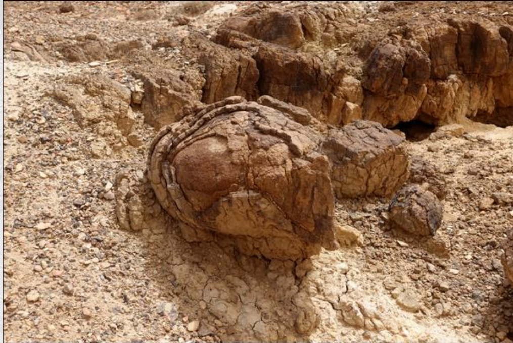
03-01. Обнажение подушечных (пиллоу-лав) мелового возраста Хэвтээ-Босоогийн , Северо-Гобийский вулканический район, аймак Дундгови. Хорошо видна слоистая структура. Координаты: 44.595357° / 105.781281°, 1233 м.