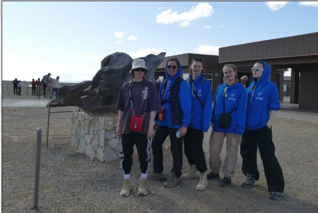
04-03. Красные песчаники, местонахождение палеонтологических остатков – Шабарак-Усу или Баянзаг . Снимок группы МГРИ у входа в Центр «Баяндзаг, пылающие утёсы» (Bayanzag - The Flaming Cliffs Center).