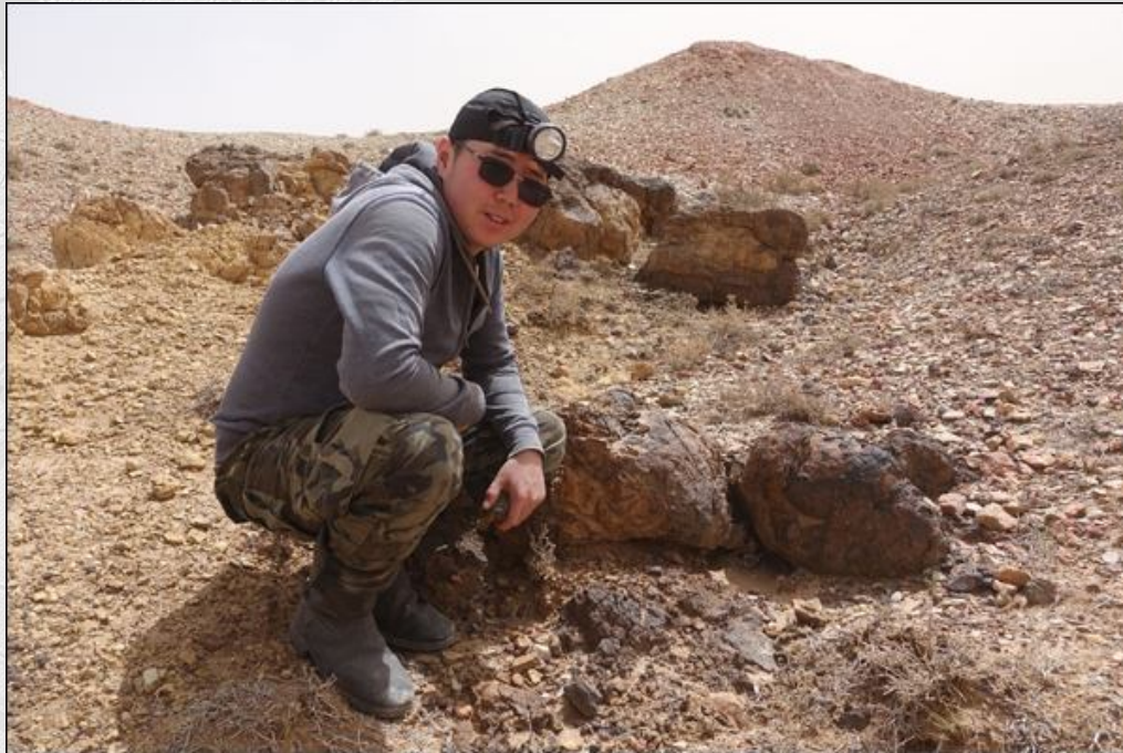
03-03. Обнажение подушечных (пиллоу-лав) мелового возраста Хэвтээ-Босоогийн , Северо-Гобийский вулканический район, аймак Дундговь. Студент Монгольского Национального университета образования на маршруте.