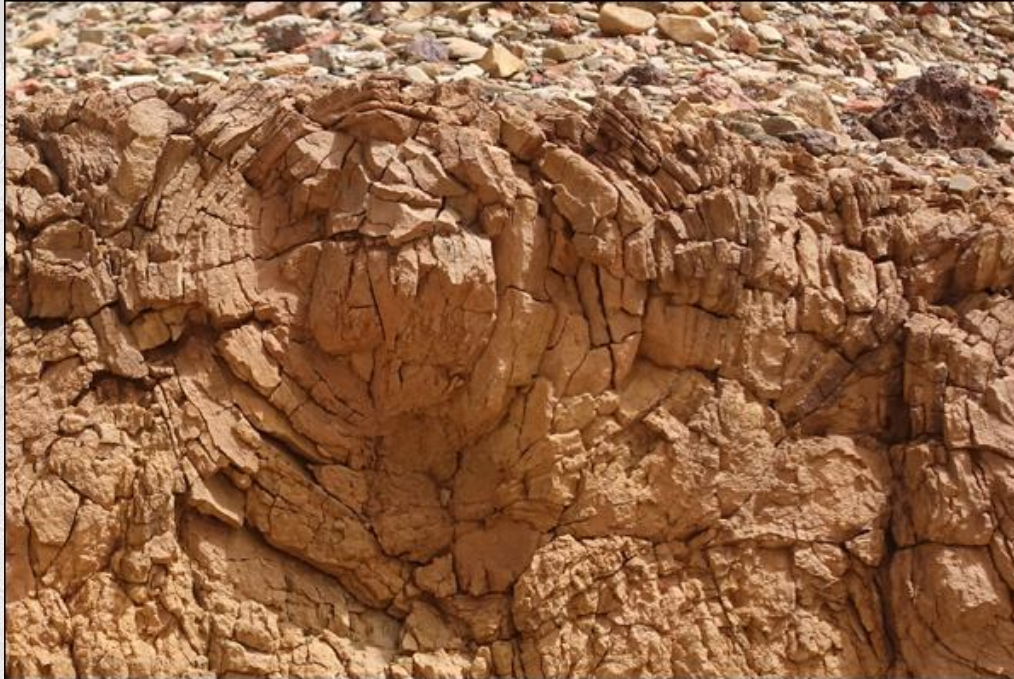
03-02. Обнажение подушечных (пиллоу-лав) мелового возраста Хэвтээ-Босоогийн , Северо-Гобийский вулканический район, аймак Дундгови. Хорошо видна слоистая структура. Координаты: 44.595357^{\circ} / 105.781281^{\circ} , 1233 м.