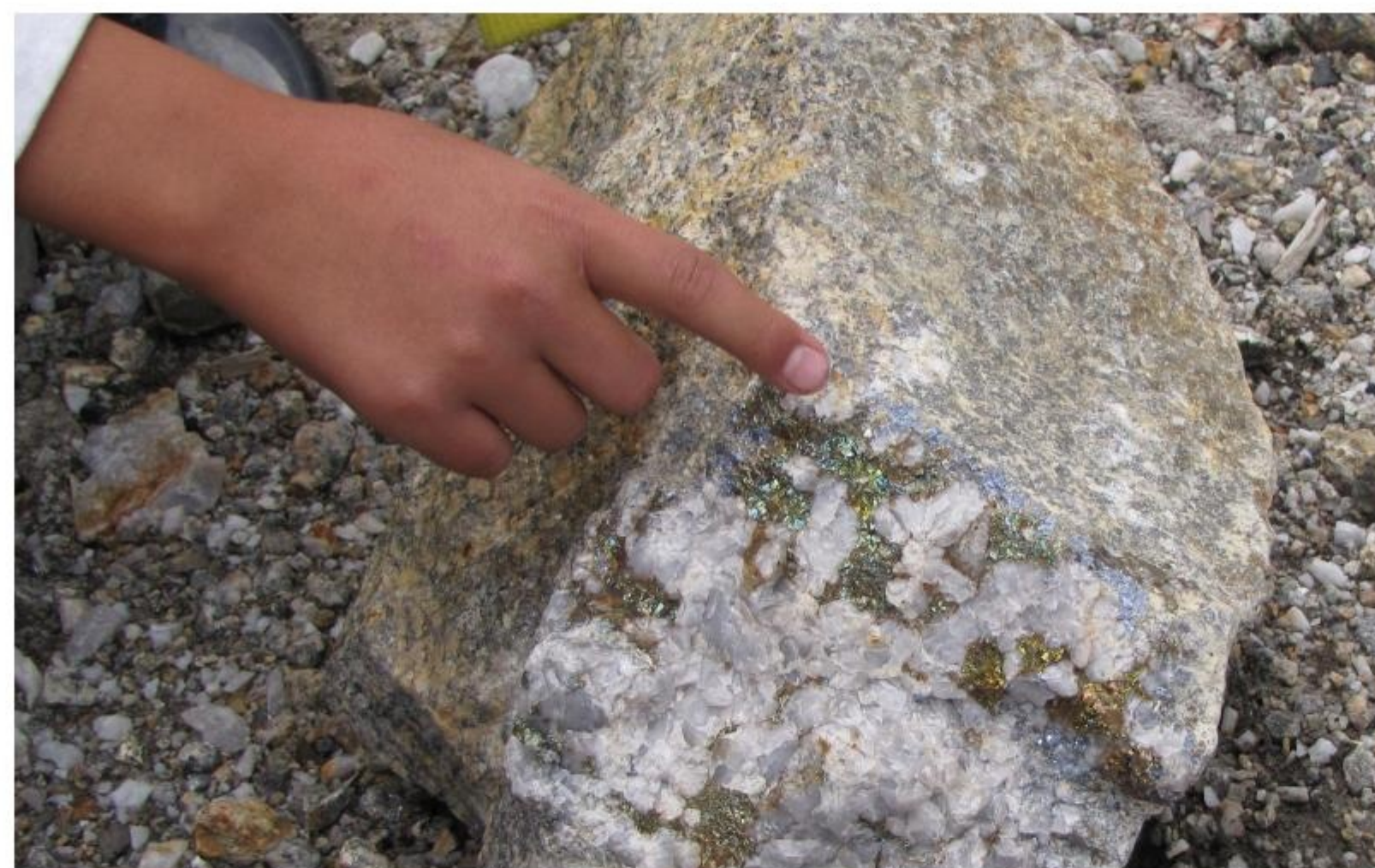
Фото Экспедиции, 2020 г.