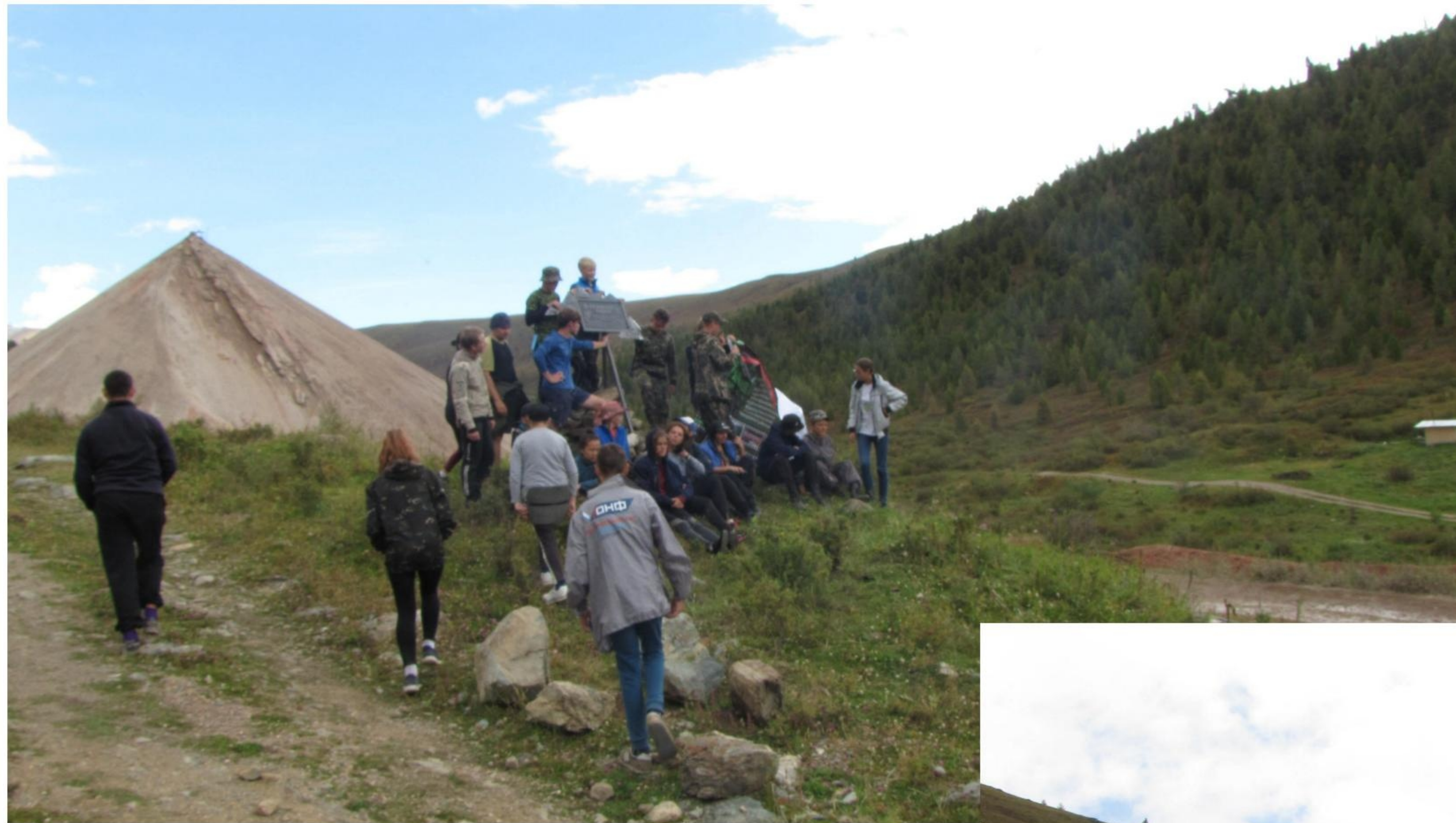
Отвалы после обогащения руды