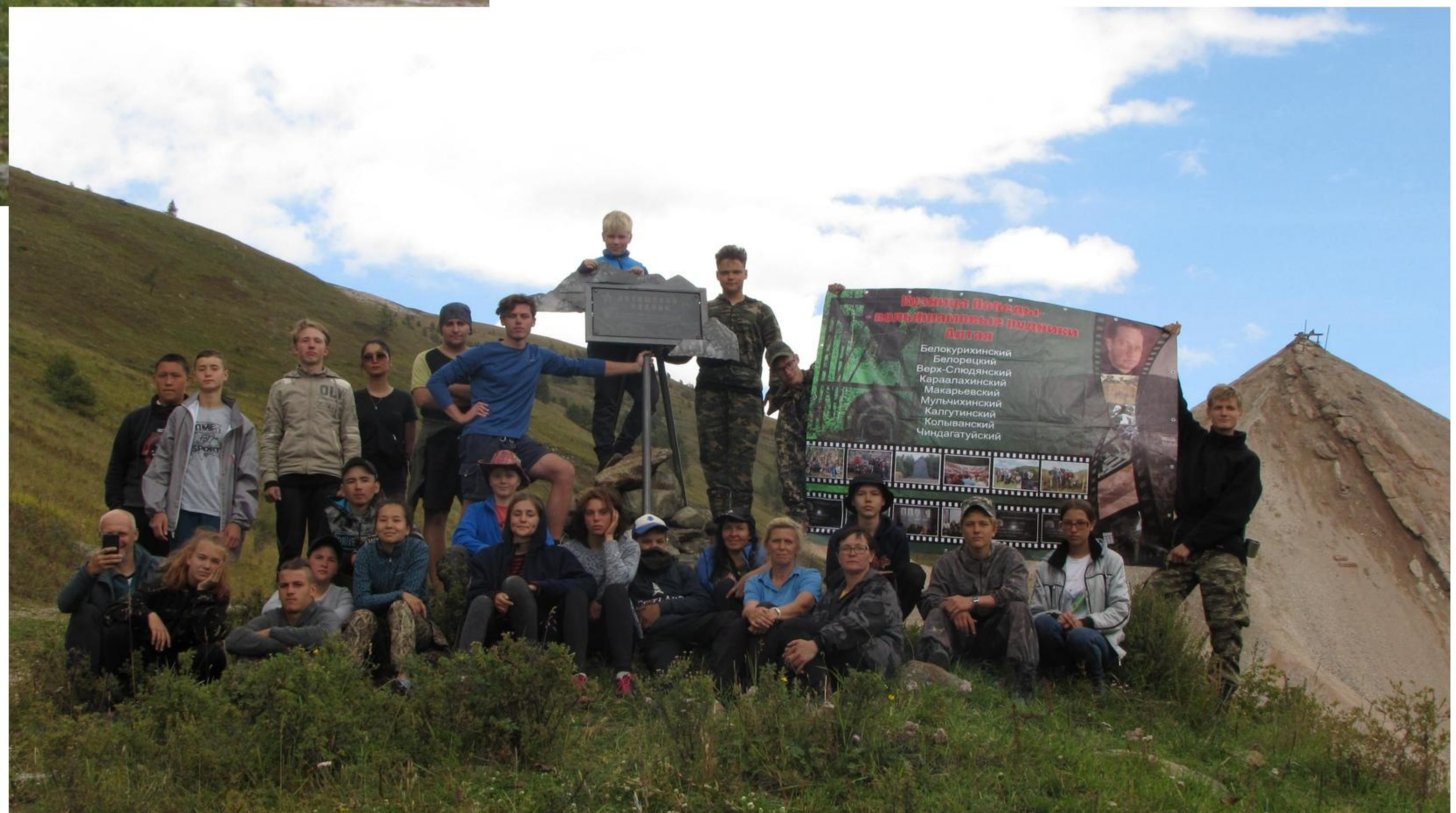
Памятный знак и его установщики Акташ, август 2020